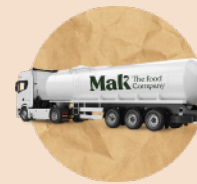
Road Tanker 25.000kg