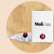
Bag in box 3-5-10-20L