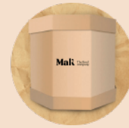
Octo bin 1.000kg